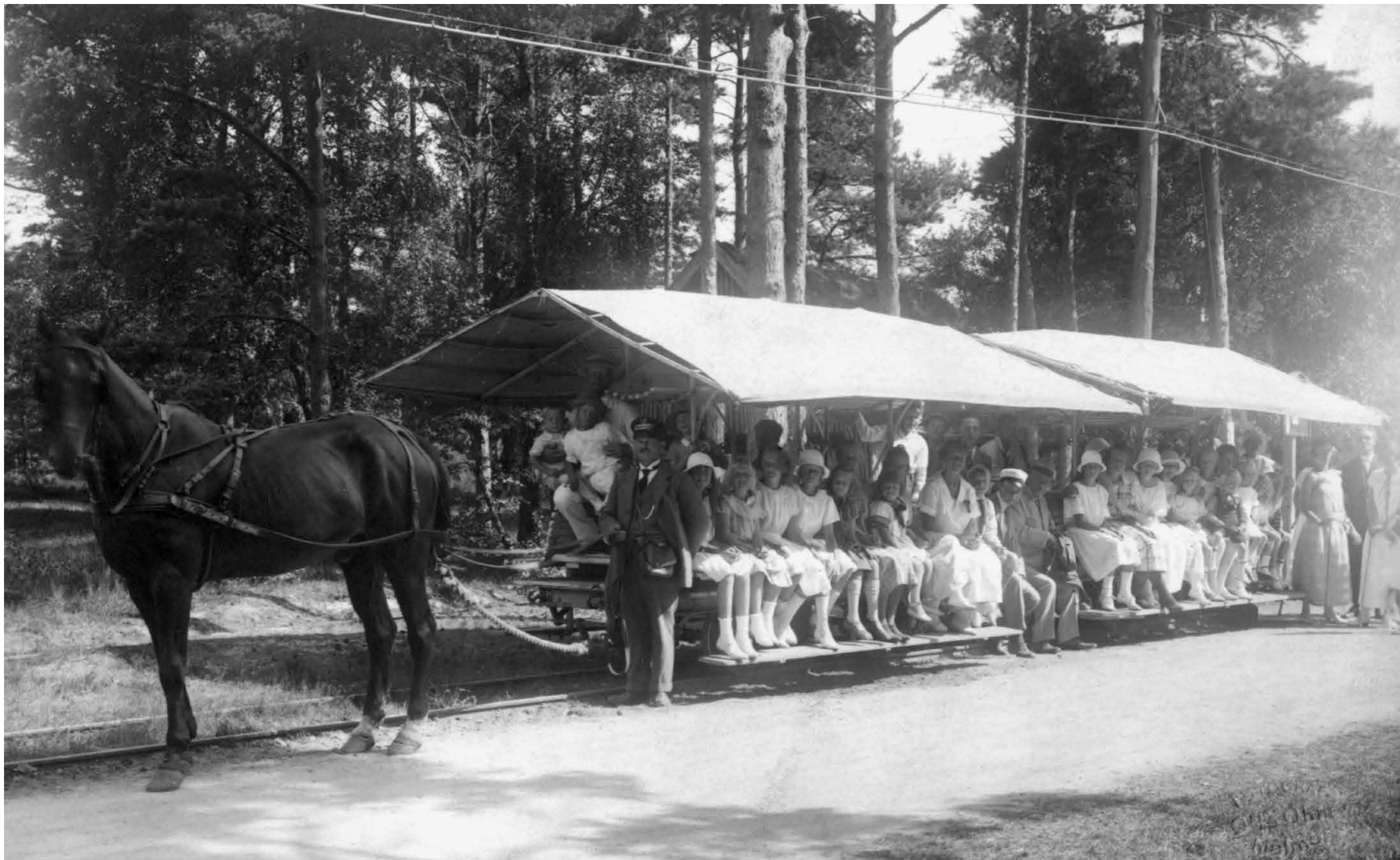
Spårvagnen med midsommarfirare.