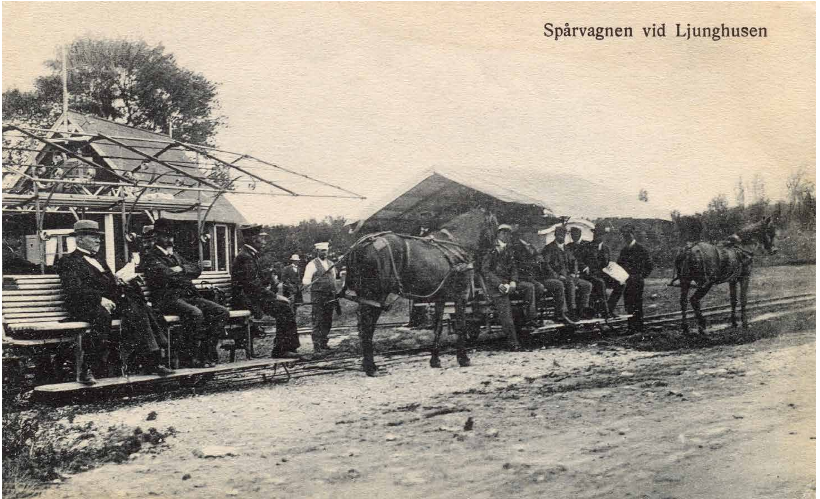
Spårvagnen vid Ljunghusens station.