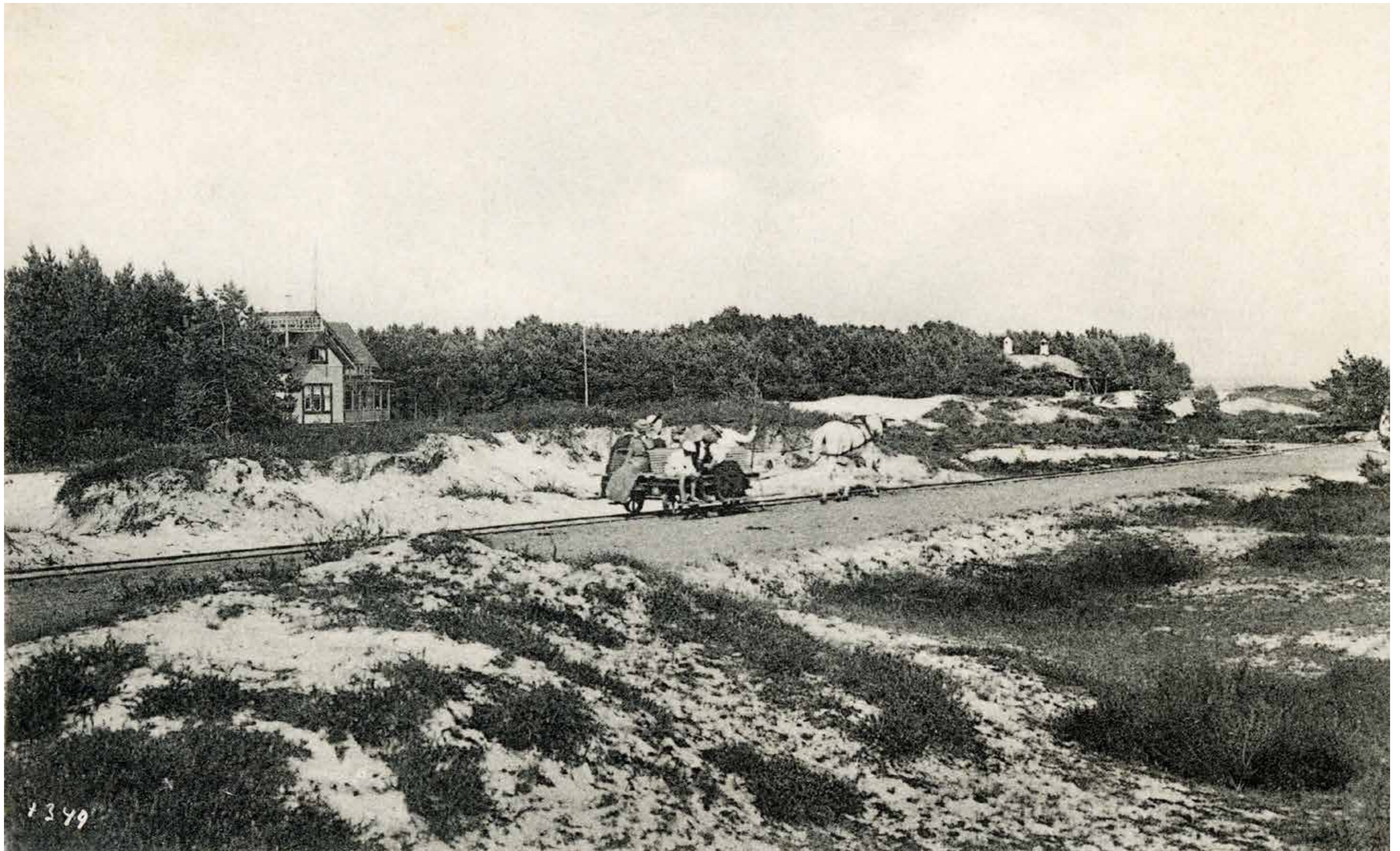
Trallan på väg mot stranden.