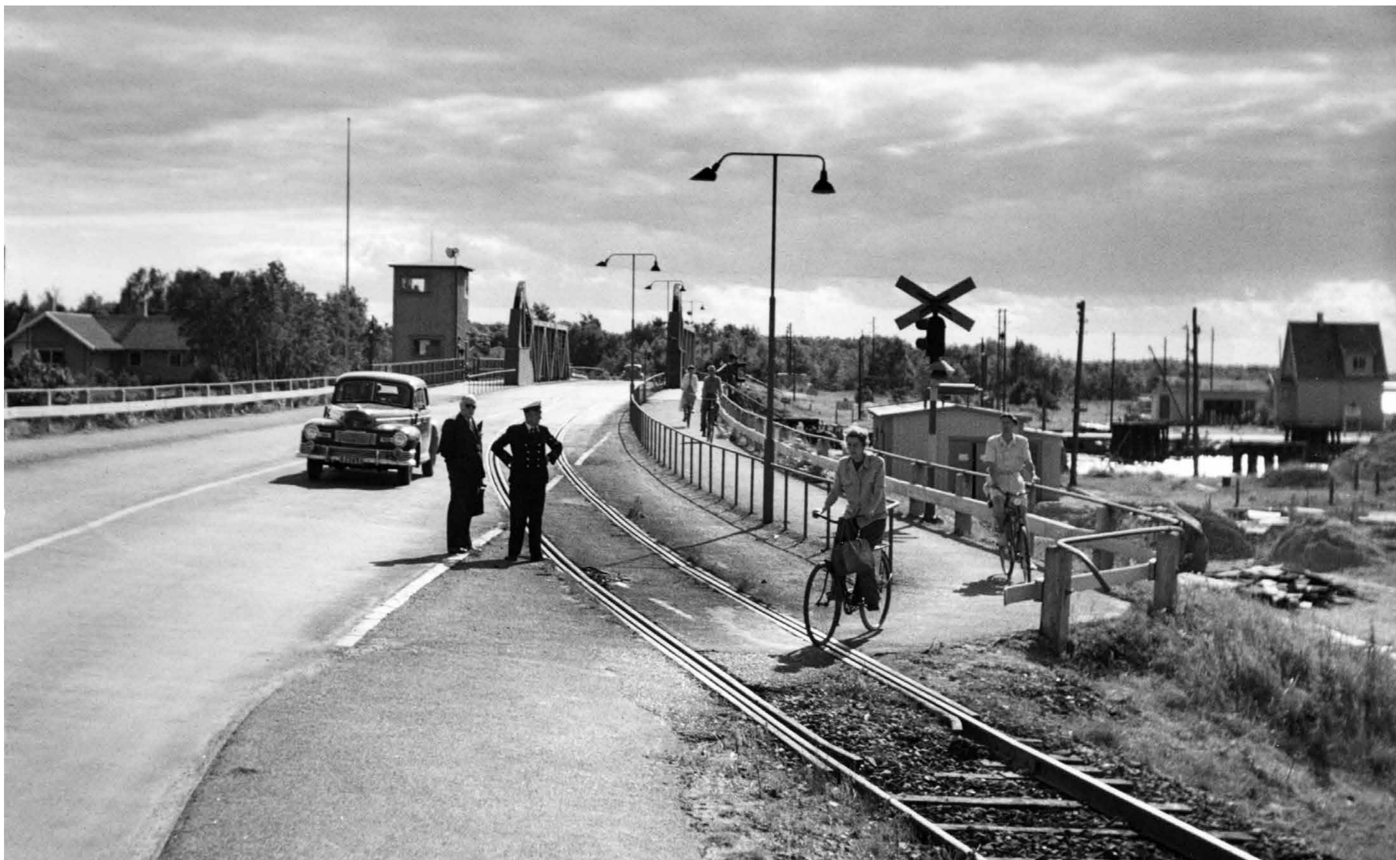
Väg 100 möter Falsterbokanalen 1948. Bilarna fick vänta om det kom tåg eller båtar. Dessa hade alltid företräde. Observera tornet på bron. Det nuvarande tornet stod klart 1955.