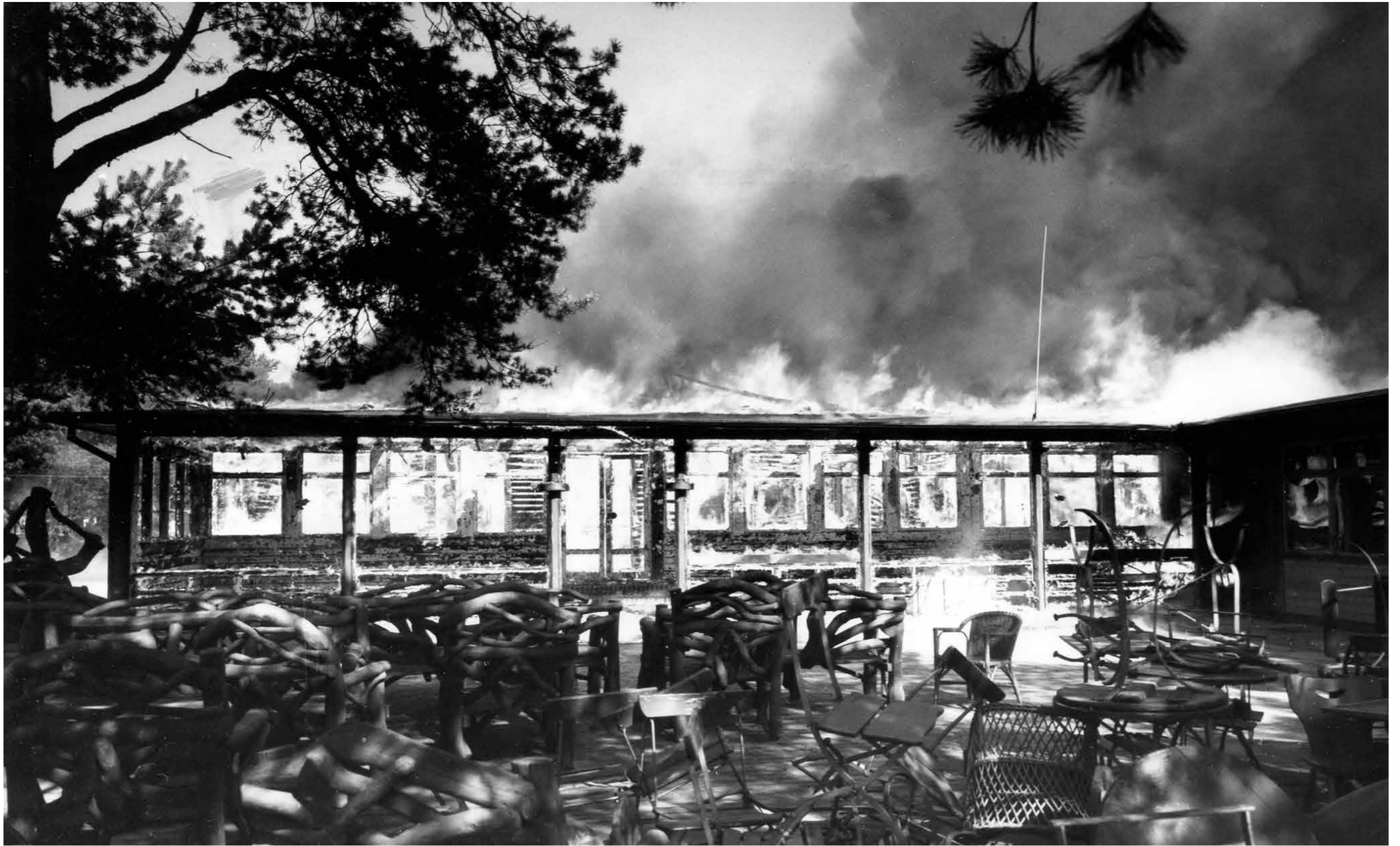
Kämpinge Badrestaurang eldhärjades den 27 maj 1958.