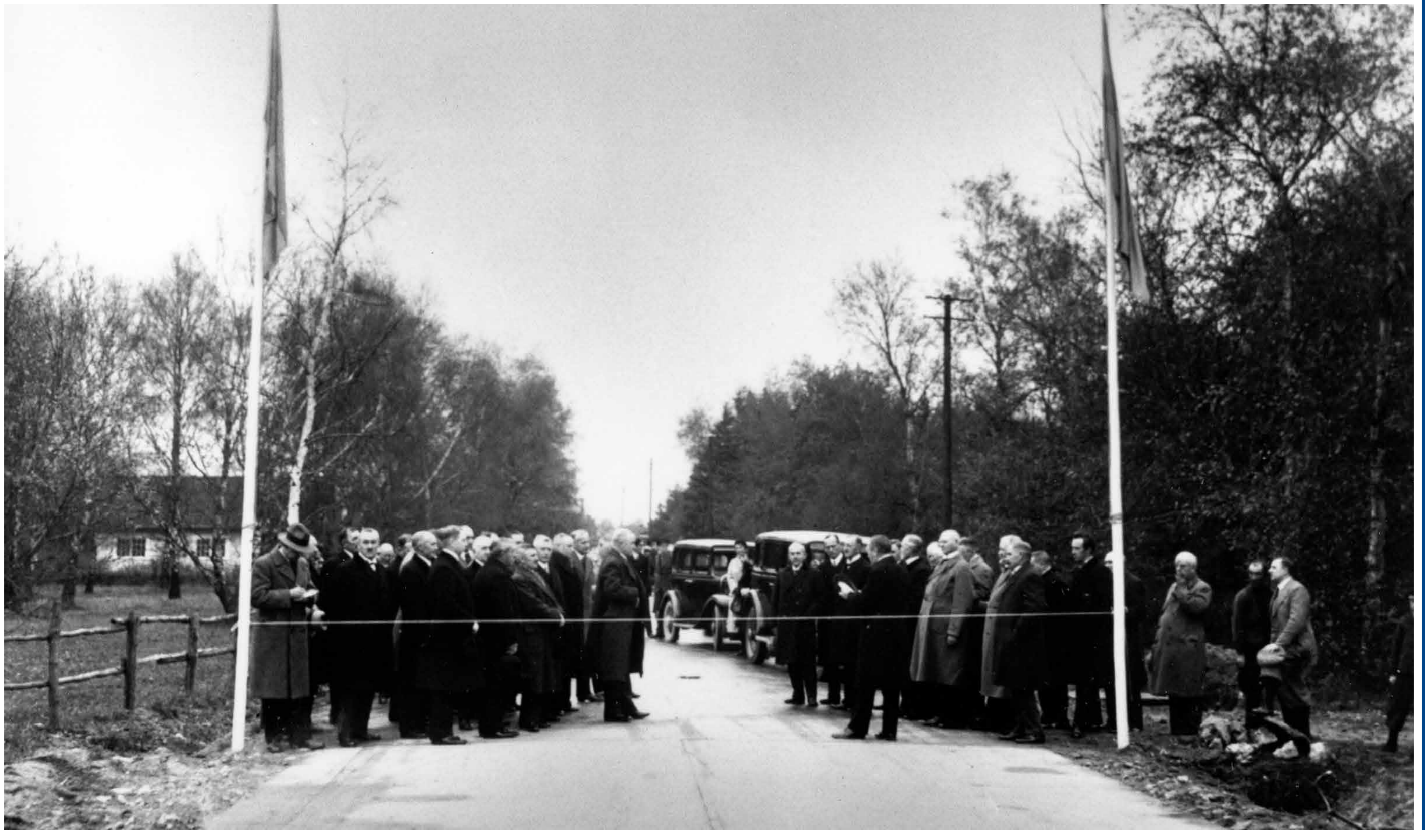
Den nya fina betongvägen ner Skanör och Falsterbo invigdes 1933. Här har Landshövdingen och andra högdjur samlats vid Norra Ljunghuset för en premiärtur.