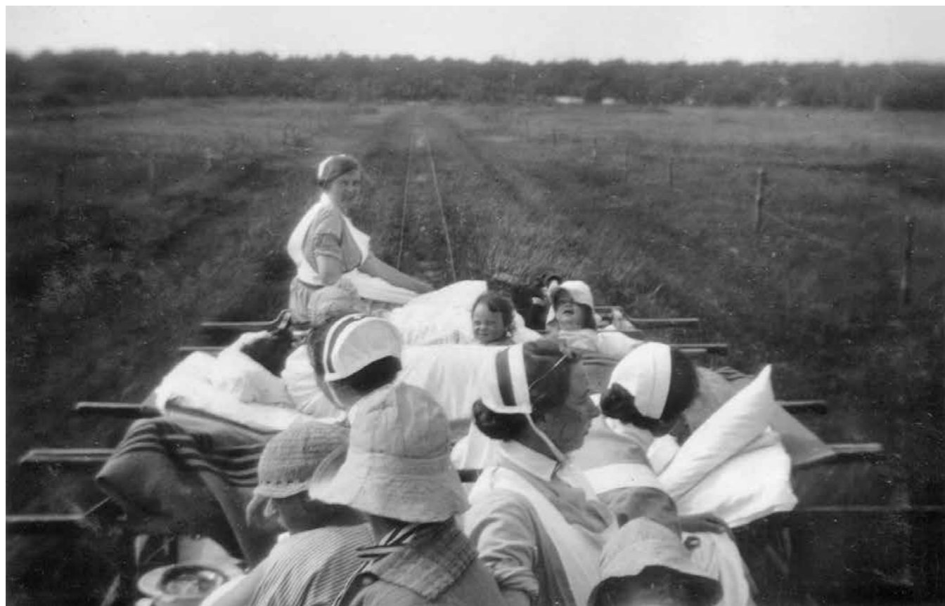
Skulle sjuksköterskorna ner och bada eller ta sig en kopp kaffe vid stranden en sommarkväll, så fanns det en mindre tralla att tillgå.