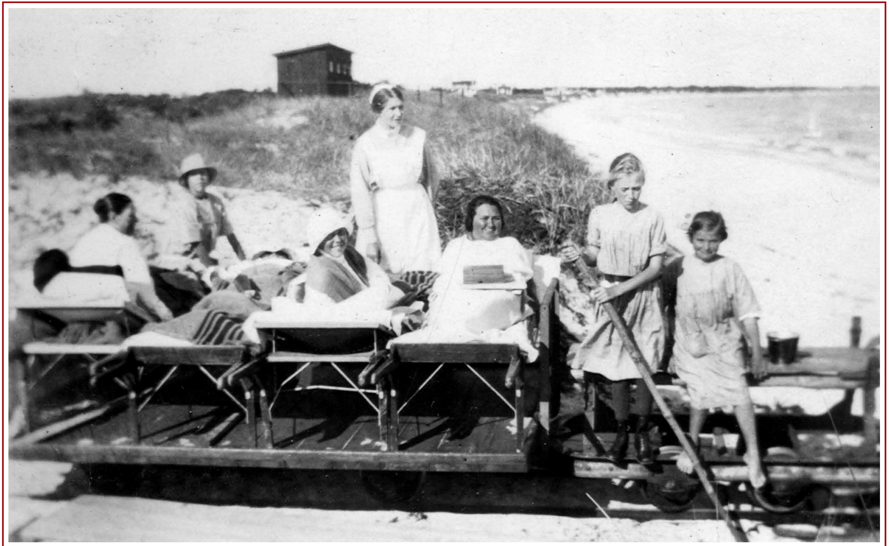
Var man inte så många kunde man staka sig ner med en käpp. Vagnen till höger är ett underrede till en tippvagn av den typ som används i gruvor och torvmossar. På detta hade man helt enkelt placerat några bräder som fick tjänstgöra som bänk.