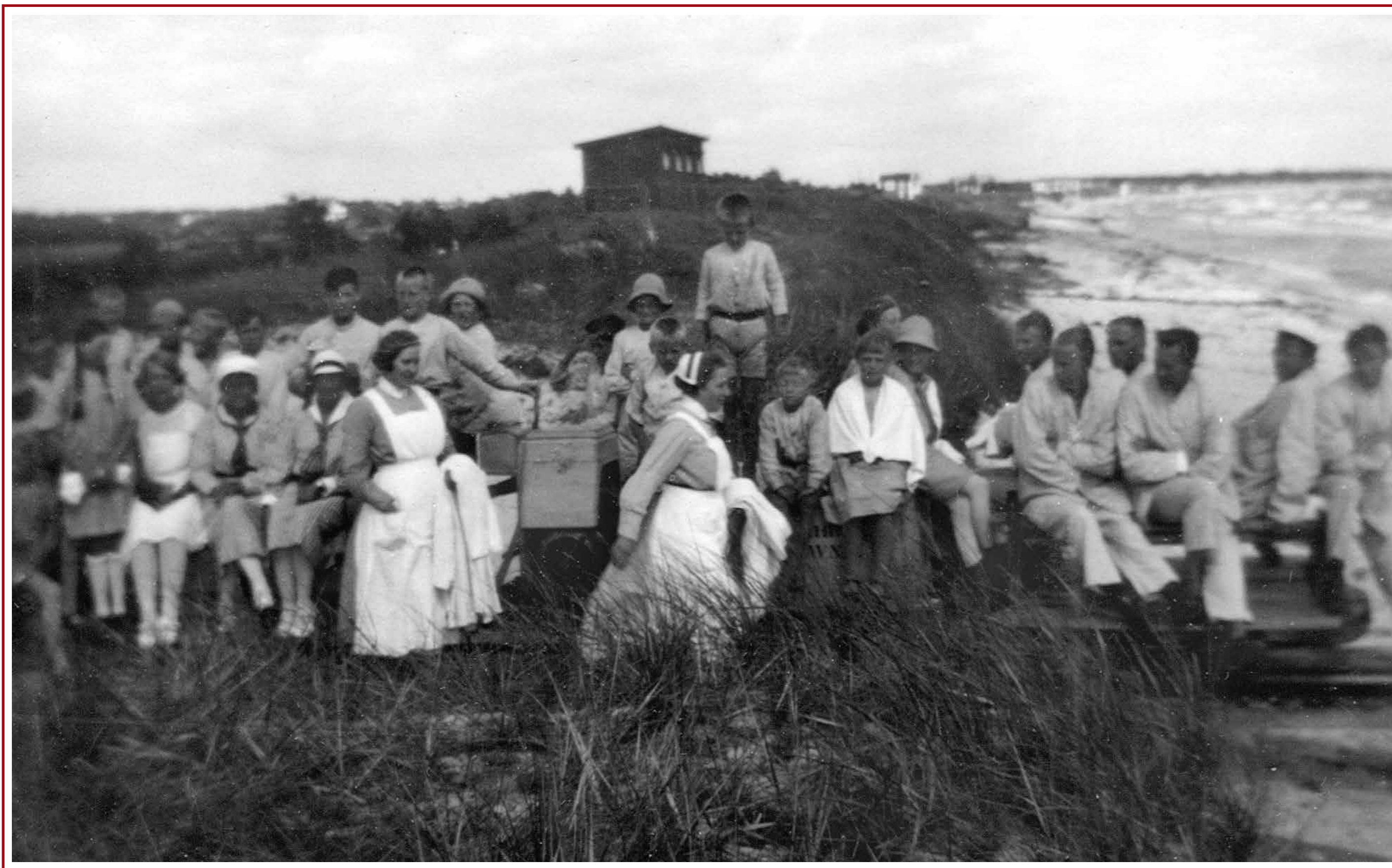
Här tycks det vara besök av syskon och vänner till patienterna. Loket ses bara som en trälåda i mitten på tåget. Den stora badhytten tillhörde sjukhuset.