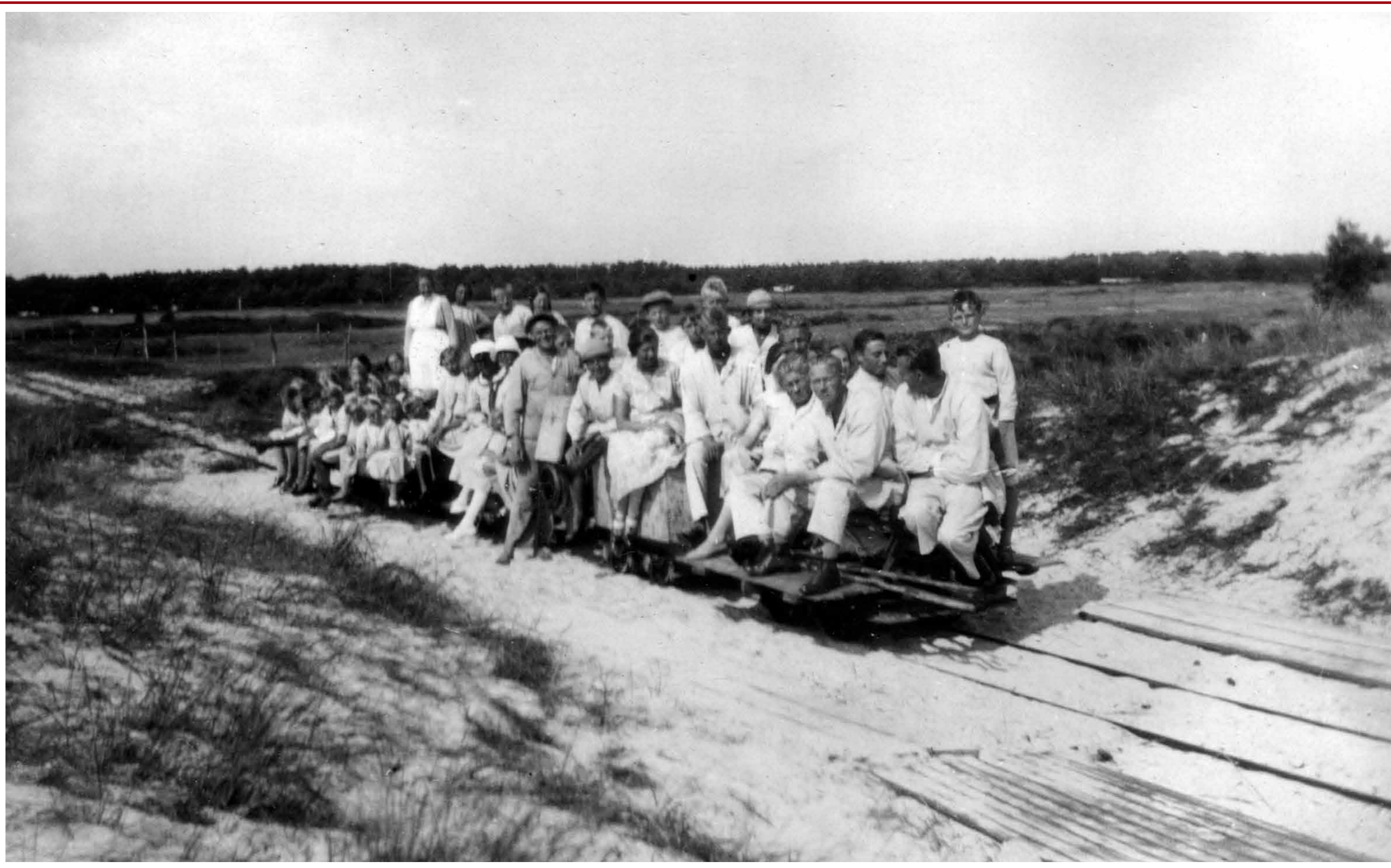
Järnvägen som inköptes från en gammal nedlagd torvmosse var smalspårig, 600 mm. Den var omkring en kilometer lång och gick fram längs nuvarande Västra Kanalvägen. Förmodligen användes den även under byggandet av kanalen.