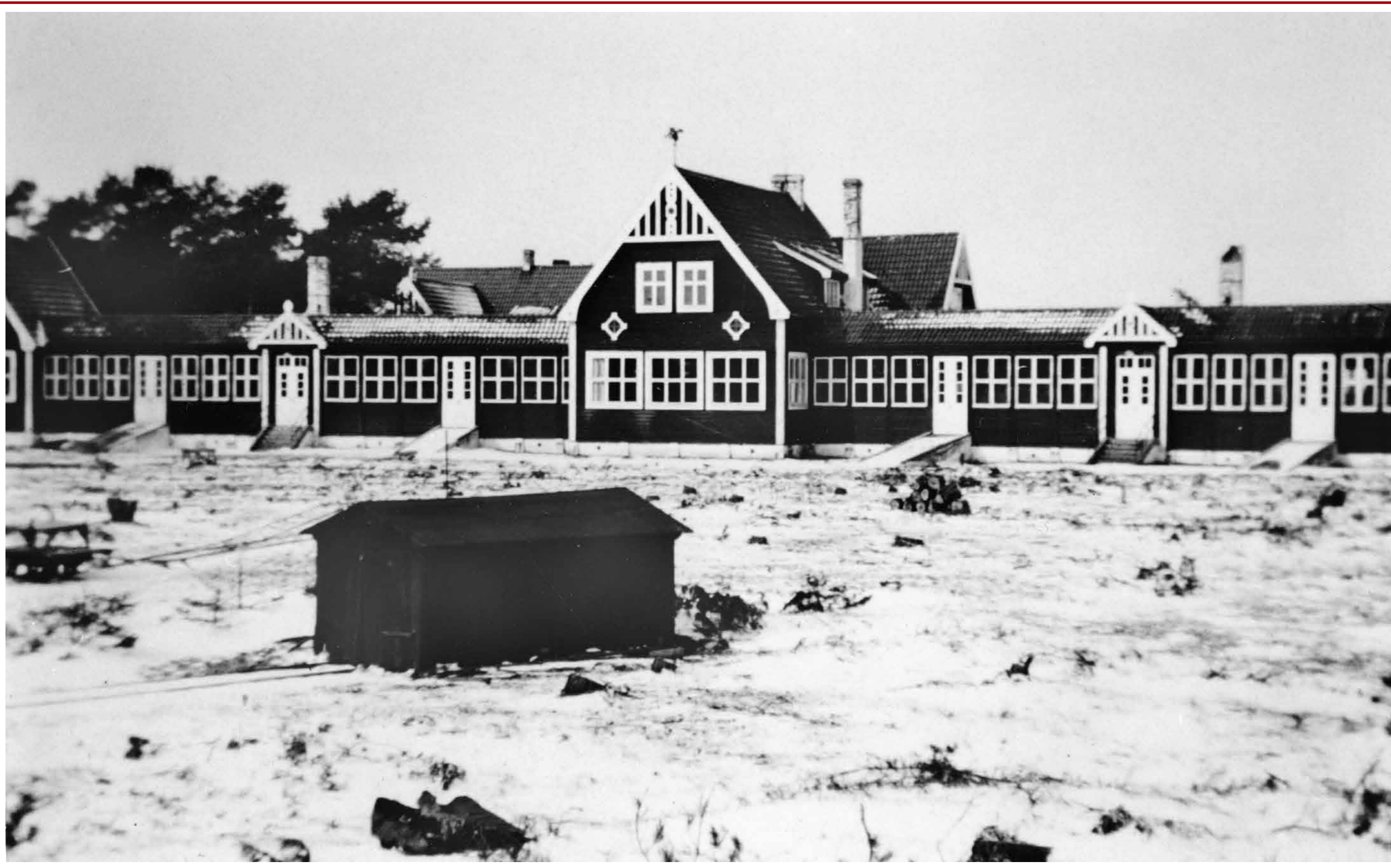
Tallarna är redan fällda. Bilden tagen i januari 1940, strax innan hela sjukhuset revs. Bakom dessa byggnader fanns hus för kök och matsalar. Det lilla huset är lokstallet! Till vänster syns en »tralla«.