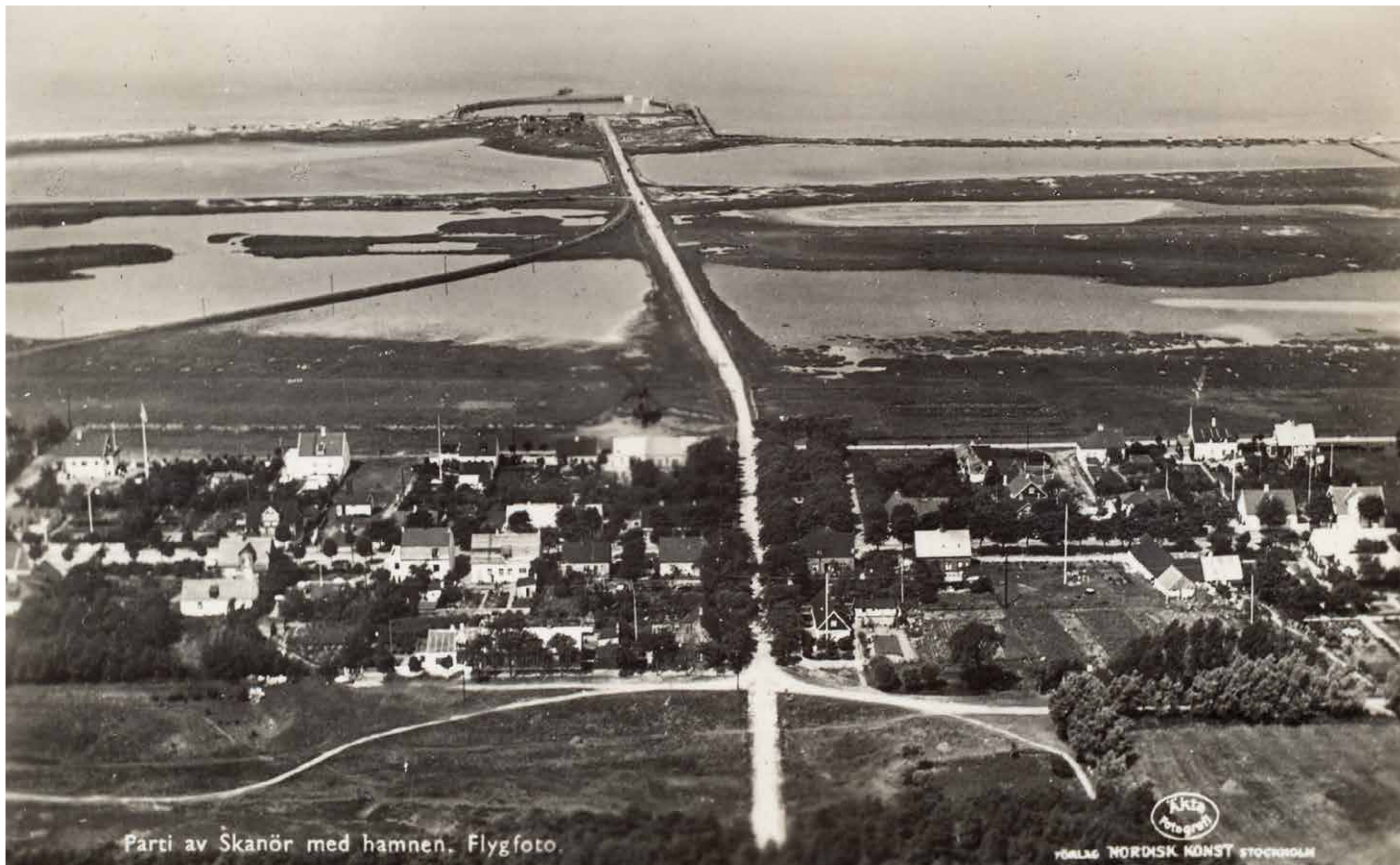
Parti av Skanör med hamnen. Flygfoto.