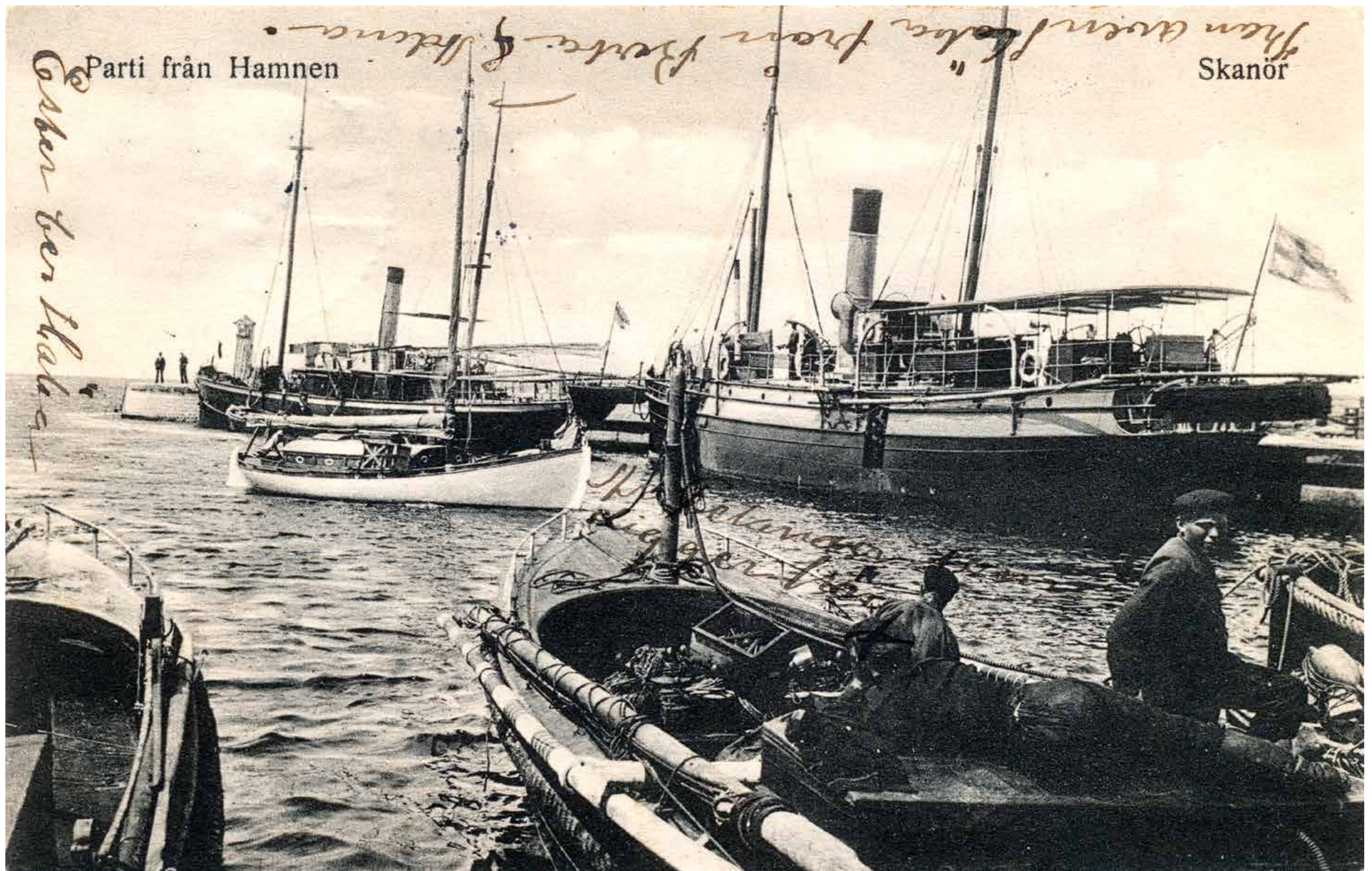
Ett vykort från omkring 1910 visar två sjömättningsfartyg med barkassar i förgrunden.