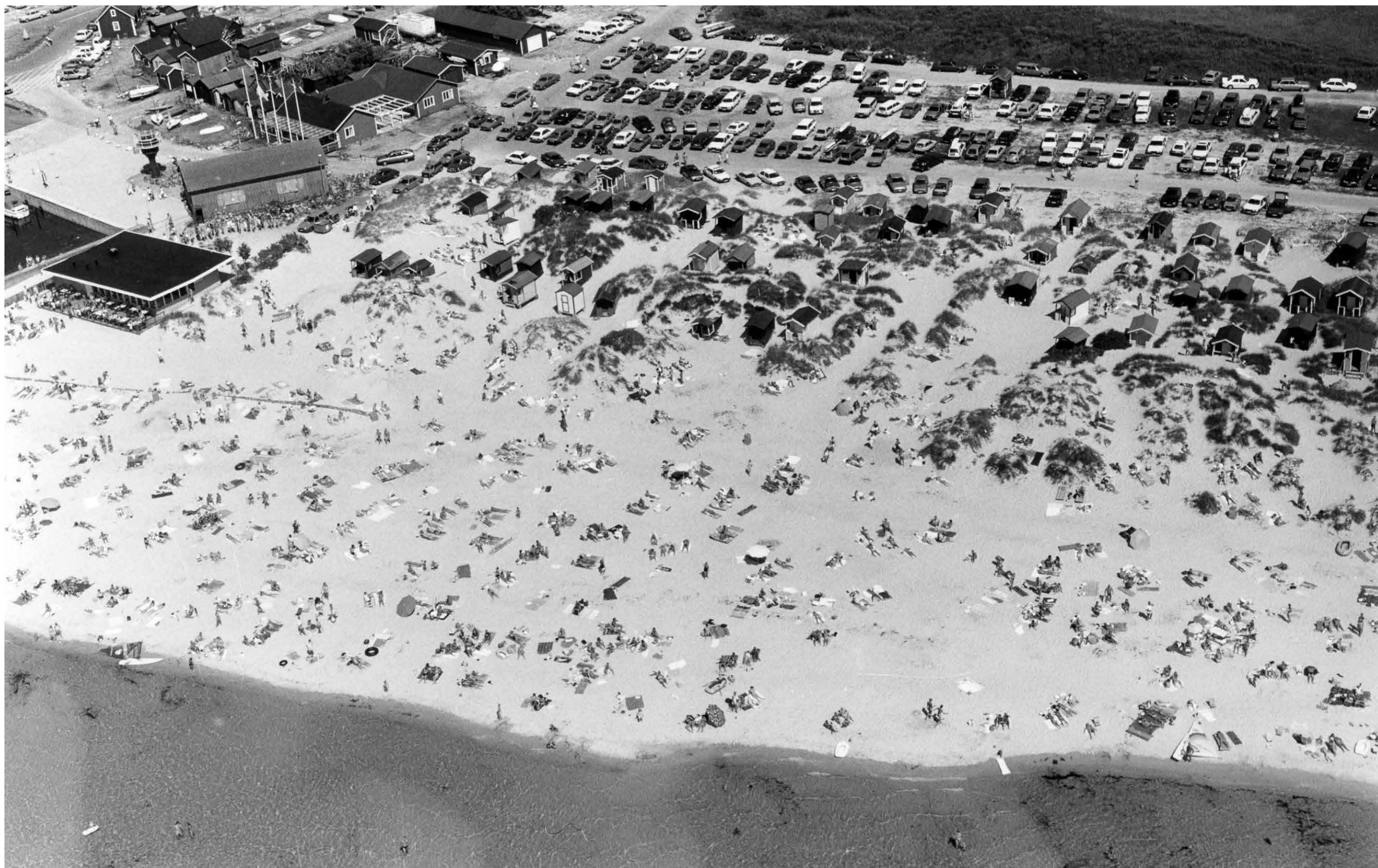
En fin baddag 1986. Sydsvenskan kostade på sig att ta en flygbild.