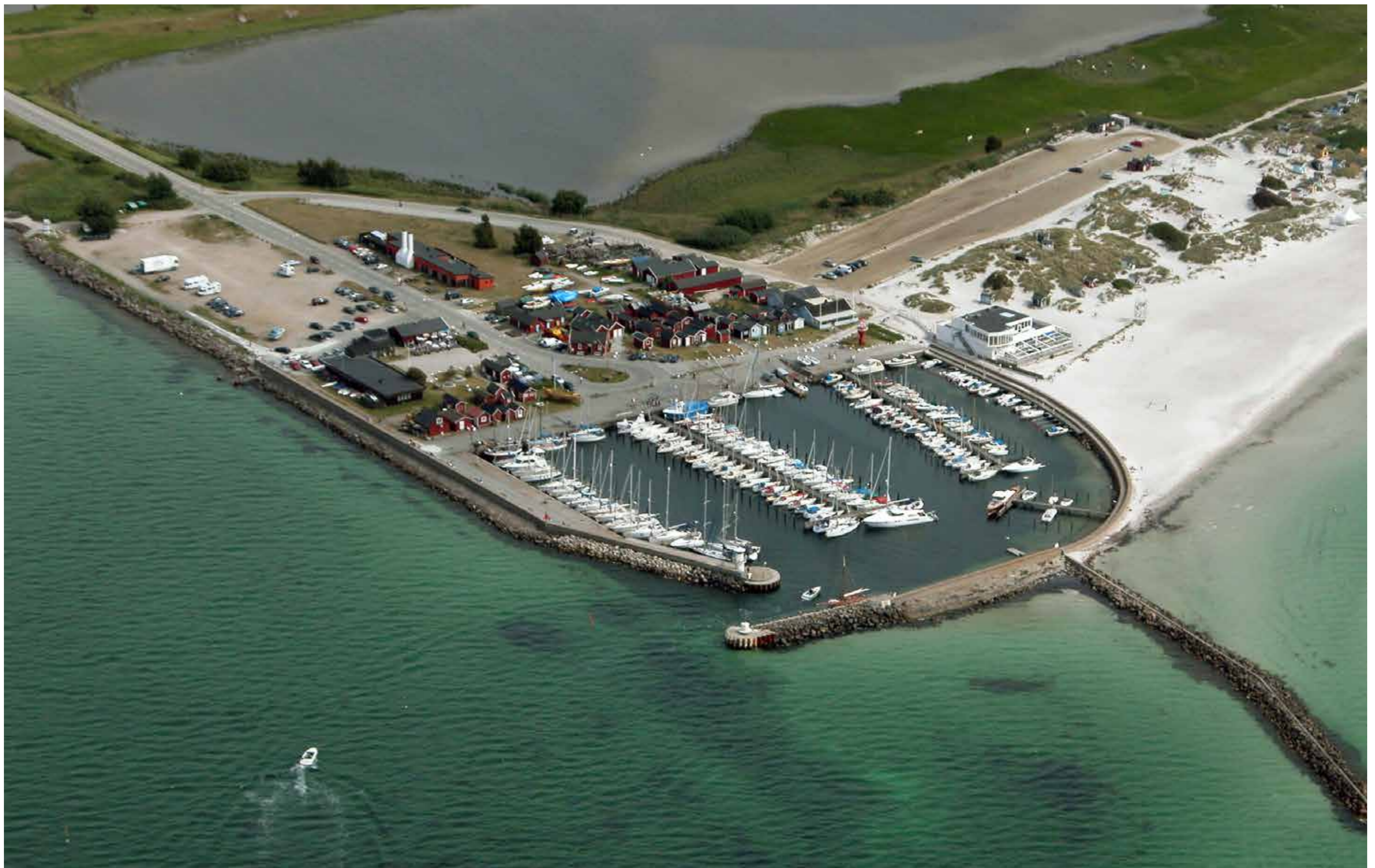
Sommaren 2007 före "Badhytten" brann ner.