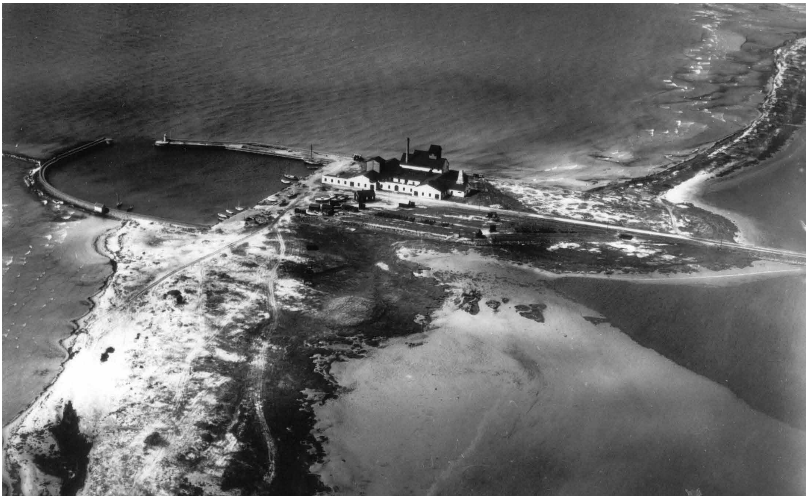
Här ligger den övergivna cementfabriken ensam i hamnen 1927. Både maskiner och byggmaterialet såldes med tiden.